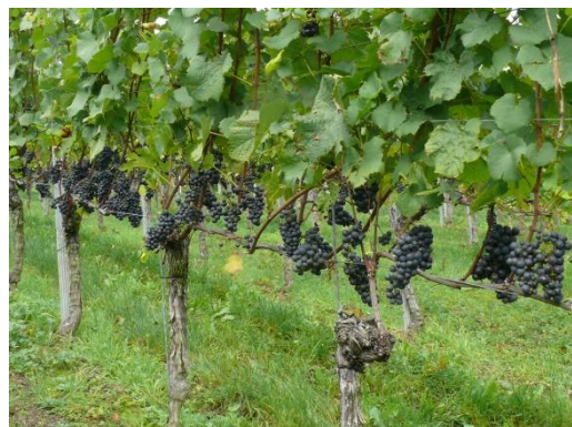
Abb. 3: In einer gut entblätternen und damit luftigen Traubenzone sind nachweislich weniger Kirschessigfliegen zu finden.