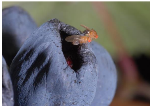
Abb. 1: Vorgeschädigte Beeren werden von Essigfliegen gerne befliegen.